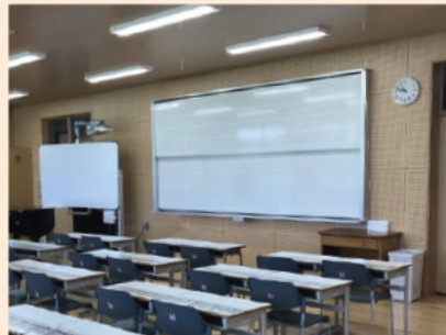
音楽室の上下ホワイトボード。