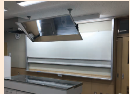
家庭科室の上下ホワイトボード。