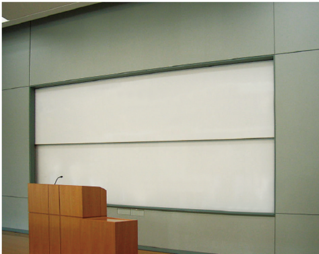
前後に2枚の黒板、ホワイトボードを電動で上下に交換できるタイプもあります。