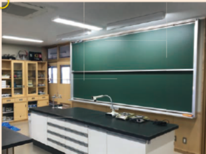
理科室の上下黒板。