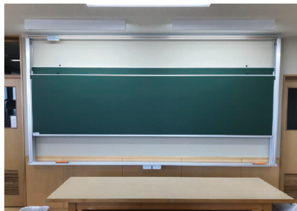
上下にセパレートしたボードがスムーズに移動します。