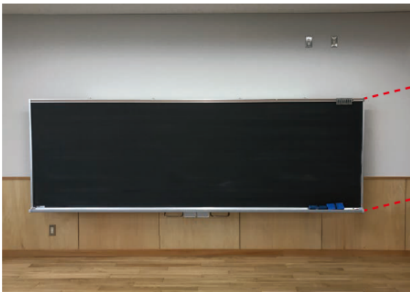
低い位置にセットした場合。

板書の時は書きやすい高さに、生徒が見る時は生徒の学年に応じた見えやすい高さにと、ボードの高さ変更が自由自在に可能なスライダー黒板です。低学年の教室ではボードを低くする必要がありますが、ワンタッチでスライドできますので小学校に最適です。