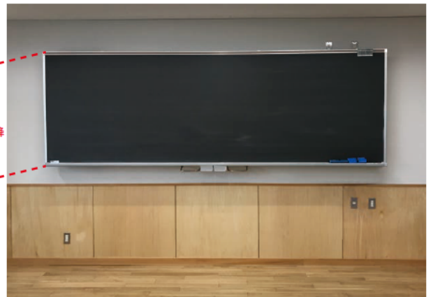
高い位置にセットした場合。