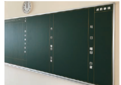
行事用黒板・ホワイトボード 予定表や行事が書き込めるタイプ。