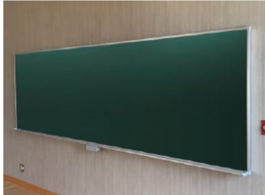
平面黒板・ホワイトボード あらゆる教室にマッチするスタンダードタイプ。