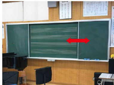
引分黒板・ホワイトボード 手動で左右にスライドできる引分タイプ。