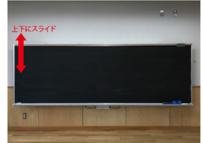
スライダー黒板・ホワイトボード 書く人の身長に合わせてボードの高さの調整が可能。