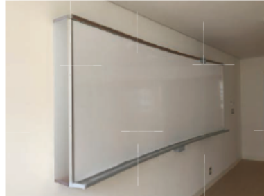
曲面黒板・ホワイトボード 曲面により反射光を抑えて黒板が見やすい。